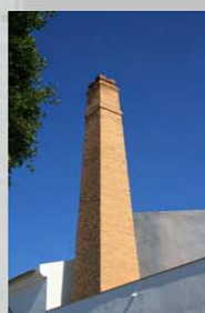
ACEITES SANTA MARIA Pto. de la Torre